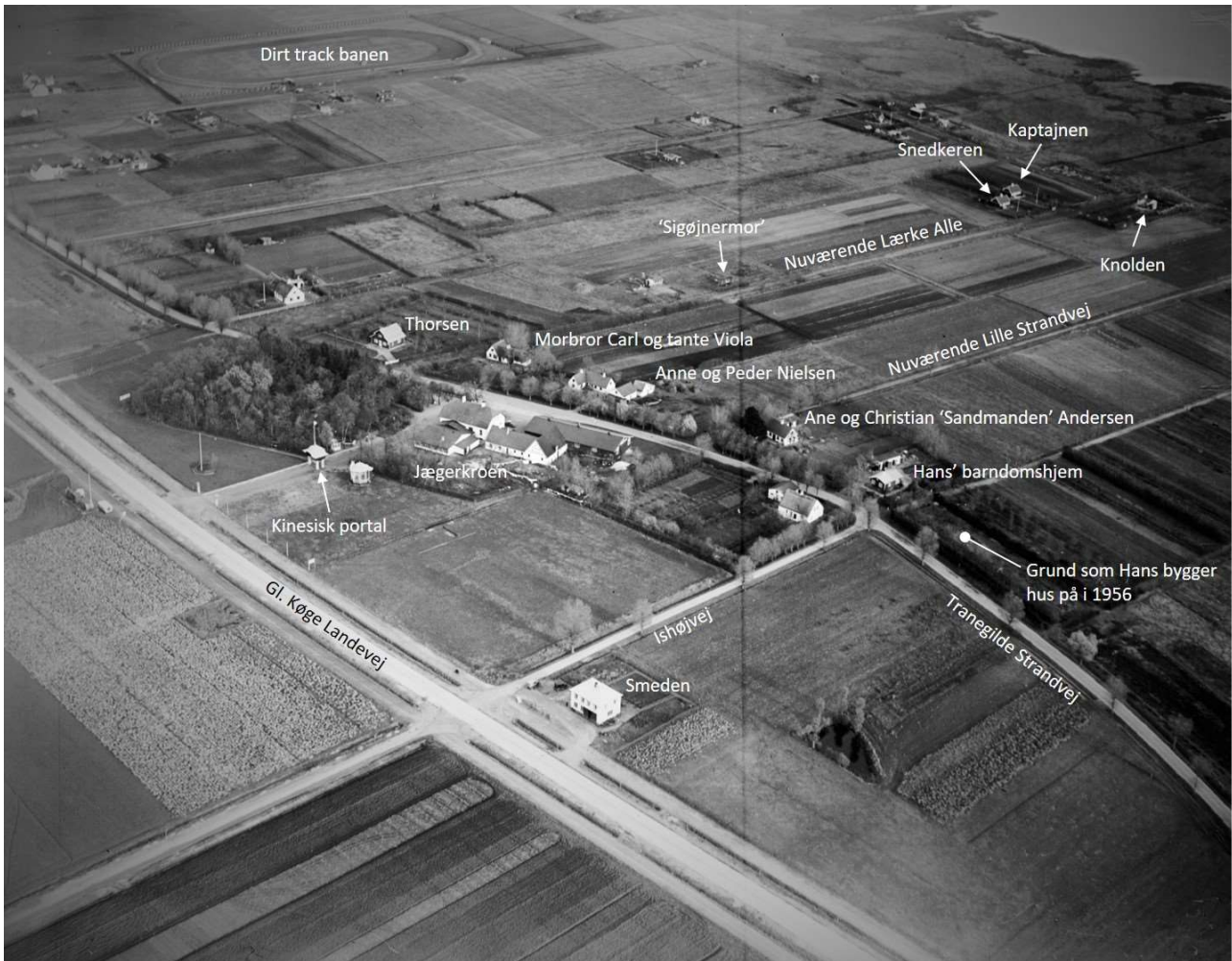
Strandområdet i midten af 1930-erne, lige efter etablering af betonvejen, som nu hedder Gammel Køge Landevej. Lokalteter og ejere af huse, som er nævnt i teksten, er markeret.

”Helt nede for enden af Lærke Alle lå Knolden og 12-meteren,” fortæller Hans om de første sommerhuse i området, som alle lå på arealerne tættest ved den sivbevoksede strandeng.